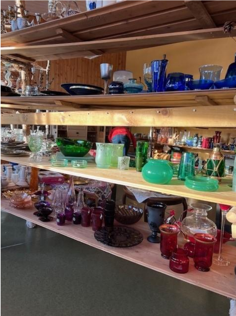
Skatter i Loppebutikken