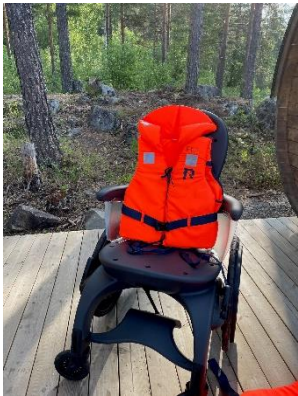
Ett utlån i sommer